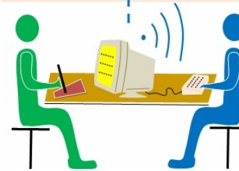
PC - blind - sehend