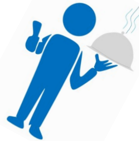
Kochen und Backen