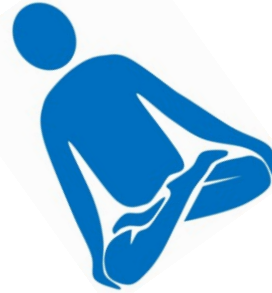
Yoga für Blinde